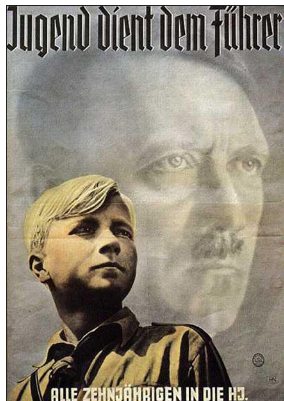
Vervingsplakat for Hitler-Jugend. Laget av Presse- und Propagandaamt der Reichsjugendführung i 1939.

I sitt politiske testamente prøver han senere å finne svært så rasjonelle forklaringer på