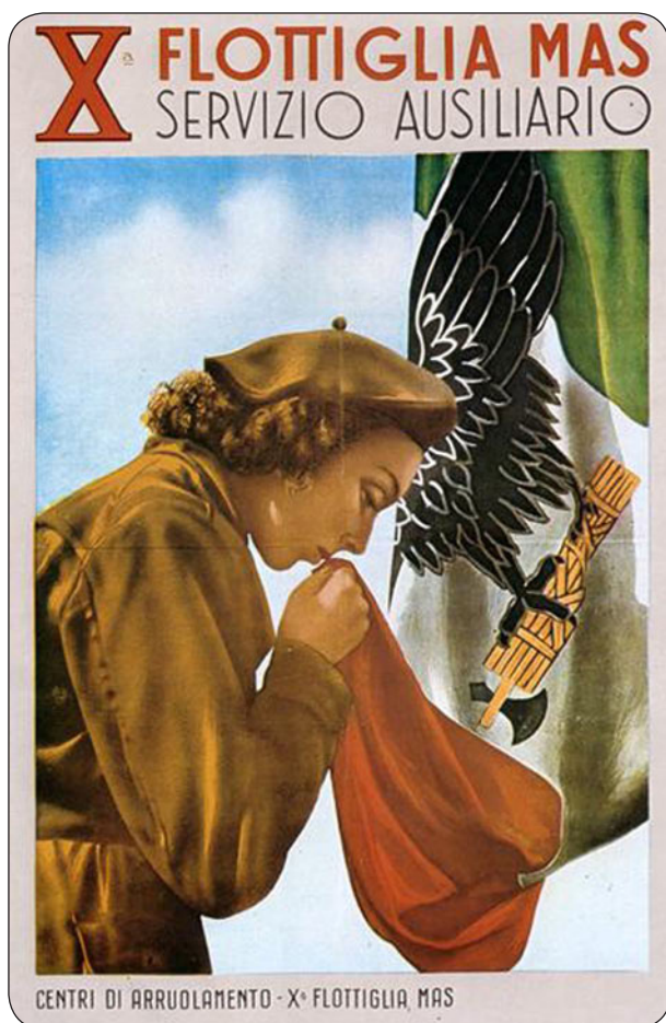
En plakat fra MAS for å verve kvinnelige pleieassistenter. MAS eller Decima Flottiglia Mezzi d'Assalto var en enhet med militære dykkere som ble opprettet av fascistene.

partiene som hadde trodd de kunne «bruke» fascistene som et redskap mot sosialister og kommunister skjønnte etterhvert at de hadde fått en temmelig varm potet i hendene. Fascistenes «gatens parlament» utfordret etterhvert regjering og statsapparat, og demonstrerte tydelig de gamle myndighetenes maktesløshet.