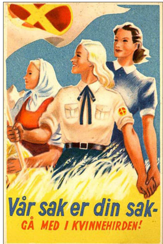
Kvinnehirden var underlagt Nasjonal Samlings Kvinneorganisasjon og hadde bl.a. sanitære oppgaver for partiet.

Jentene som den ene dagen syklet med posten var gjerne også neste dag deltagere i idrettsarrangementer der de hovedsakelig fikk vise seg fram i «estetiske» masseidretter der skjønnhet og ynde var langt viktigere kriterier enn styrke.