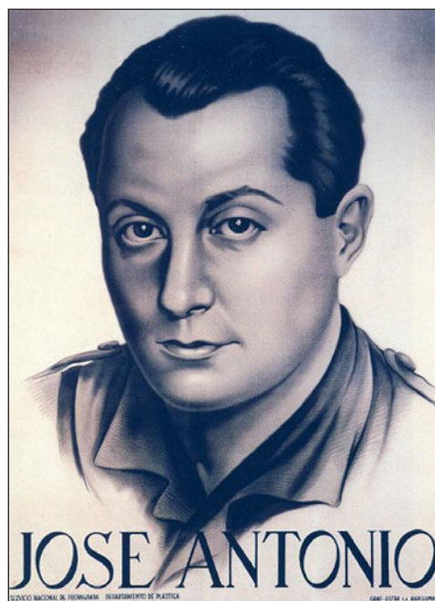
José Antonio Primo de Rivera var lederen av Falange Española. Hans søster, Pilar, startet for øvrig den kvinnelige grenen av Falangen, Sección Femenina.

En av de fengslede lederne, Ruiz de Alda, erklærte fra fengslet at en borgerkrig alt var i gang og at ingen restriksjoner på voldelige aksjoner lenger eksisterte.