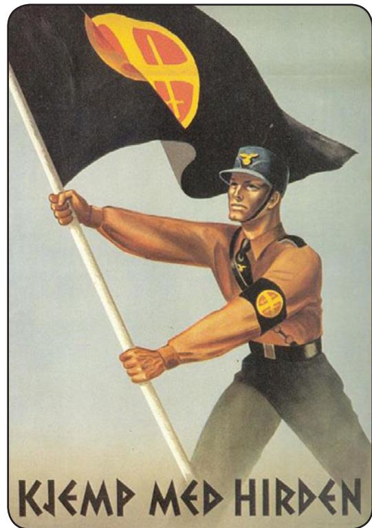
Hirden var Nasjonal Samlings politiske soldater og var i utgangspunktet ikke bevæpnet, men i 1943 deltok enkelte avdelinger i våpenøvelser for å tjene som norsk reservepoliti.

Deportasjonene av norske jøder til konsentrasjonsleirer som Auschwitz kastet ikke bare et grelt lys over NS og norske nazister, men stiller også enkelte andre såkalte «gode borgere» i et